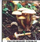
Несправжній опецьок сірністо-жовтий