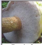
Жовчний гриб (гірчак)