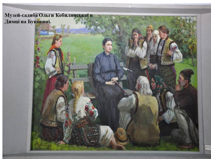
Музей-садиба Ольги Кобилянської в Димці на Буковині.