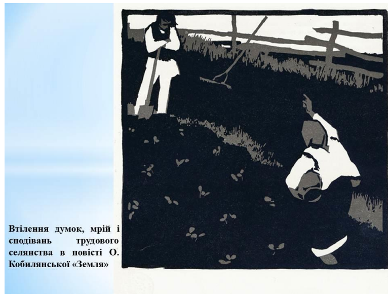
Втілення думок, мрій і сподівань трудового селянства в повісті О. Кобилянської «Земля»