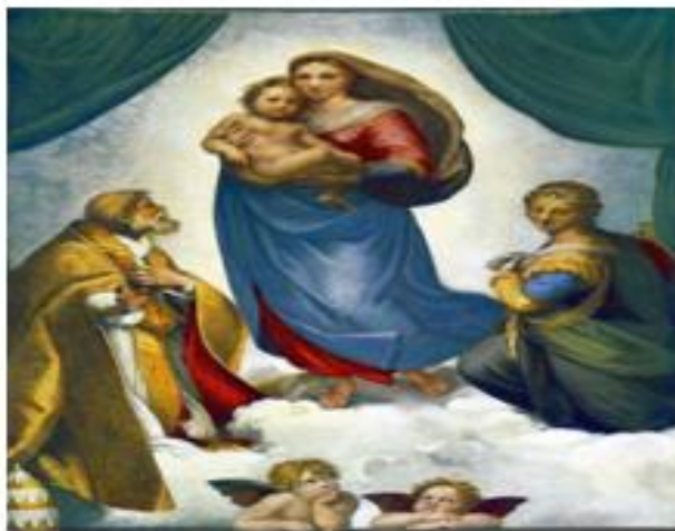
Рафаель. Сікстинська мадонна